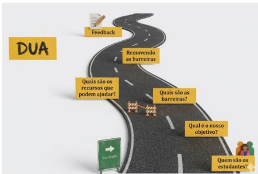
FIGURA 2 – Roteiro de questões para a elaboração de aulas na perspectiva do DUA