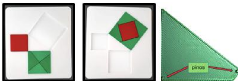
FIGURAS 3a, 3b e 3c - Etapas de montagem do quebra-cabeça pitagórico impresso em 3D 4 .

Na tarefa que utiliza o quebra-cabeças feito com impressora de modelos 3D, o grupo receberá um kit contendo um tabuleiro e suas peças (figura 3a). Em um questionário impresso à tinta (e em Braille, caso necessário) o grupo deve responder às seguintes questões: 1) Antes de resolver o quebra-cabeças, descreva brevemente as figuras geométricas que o compõem e como elas estão dispostas no tabuleiro. 2) Que relações vocês perceberam após a resolução do quebra-cabeças? 3) Que conceitos da geometria vocês podem relacionar à resolução do quebra-cabeças?