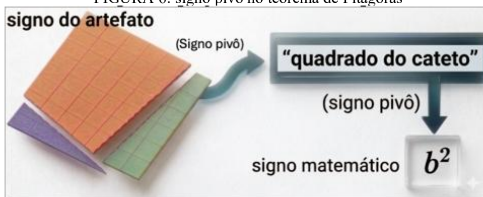
FIGURA 6: signo pivô no teorema de Pitágoras