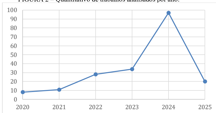
FIGURA 2 – Quantitativo de trabalhos analisados por ano.

As publicações estão concentradas no período entre 2020 e 2025, com um pico em 2024, conforme ilustrado no gráfico da FIGURA 2. Esse aumento coincide com a expansão do uso de ferramentas de IA generativa, como o ChatGPT .